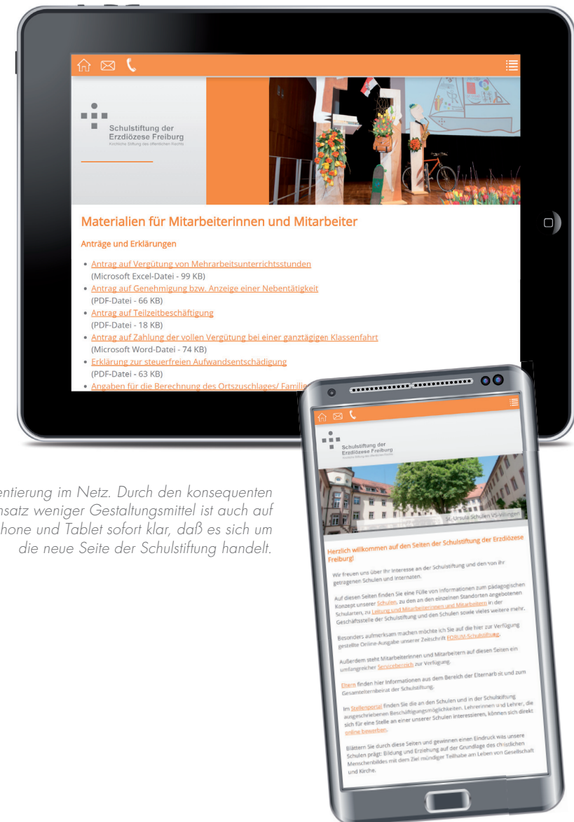
Orientierung im Netz. Durch den konsequenten Einsatz weniger Gestaltungsmittel ist auch auf Smartphone und Tablet sofort klar, daß es sich um die neue Seite der Schulstiftung handelt.

Was dort aber hinzukommt: die Tablet-Nutzung! Insbesondere ab 16 Uhr (also nach Büroschluss) schwenken die Zahlen hin zu 90% bis 100% (abzüglich Smartphones) – zu Hause scheint also niemand mehr mit PCs zu arbeiten, sondern nur noch mit Tablets und Smartphones. Nur in der klassischen Mittagspause haben wir noch auffällige Zugriffe über konventionelle Geräte.“