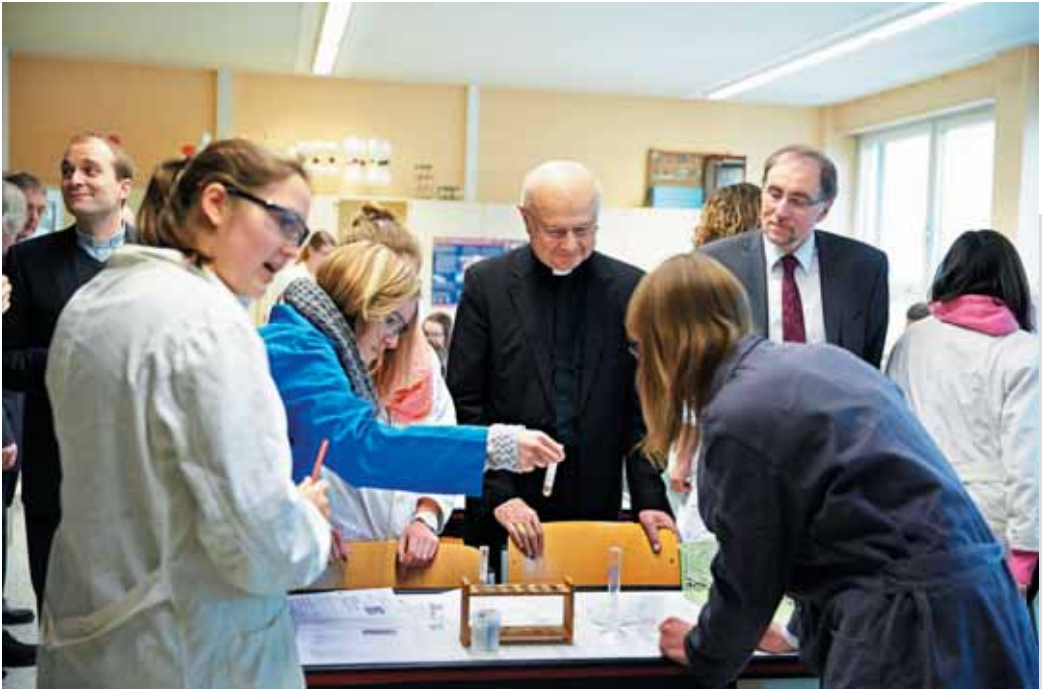
Erzbischof und Stiftungsdirektor als interessierte Zuschauer im Chemieunterricht: blaue Gummibärchen