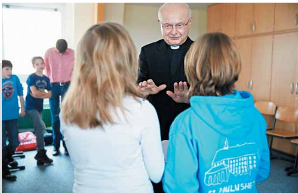
Schüler und Schülerinnen interviewen den Erzbischof