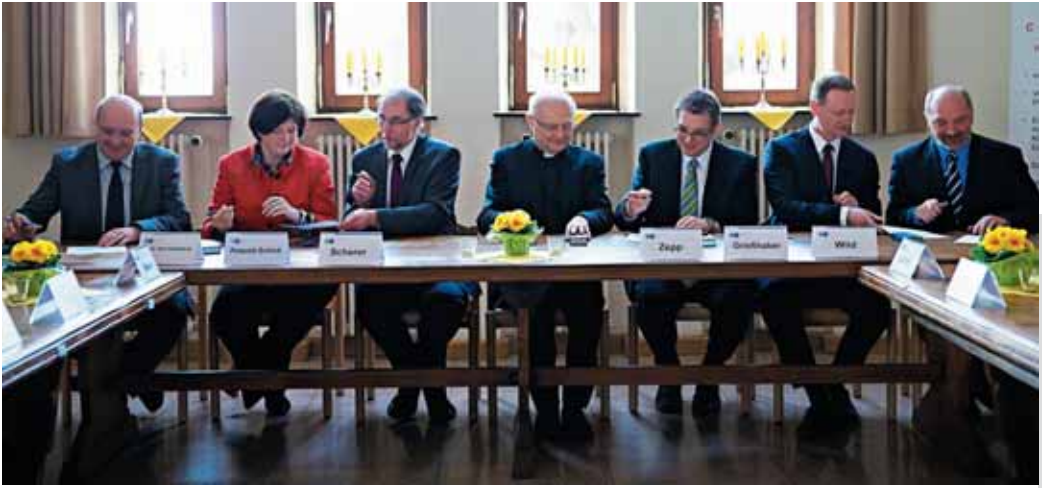
Feierliche Unterzeichnung des Kooperationsvertrags

nung, von Gott geliebt zu sein. Daraus sei ihm der Mut zu seinem Einsatz für die Kirche, besonders für den Dienst der Laien in der Kirche gekommen.