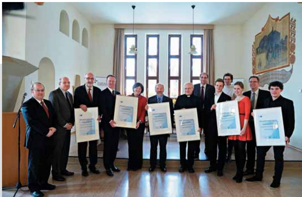
Wirtschaft macht Schule – und alle gewinnen