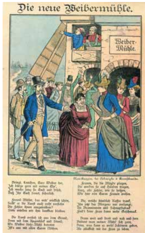
„Forever young“ Anno 1887 durch „die neue Weibermühle“ auf einem Neuruppiner Bilderbogen

Eine solche Ernüchterung würde das Ende des salbungsvollen Tons bei Reden über die Gesundheit bedeuten und die Chance für einen realistischen Gesundheitsbegriff: „Gesundheit ist dasjenige Maß an Krankheit, das es mir noch erlaubt, meinen wesentlichen Beschäftigungen nachzugehen“ (Friedrich Nietzsche). Das ist viel näher an der alten hippokratischen Tradition der Medizin. Für Hippokrates gab es nicht Krankheit oder Gesundheit, das prägt erst später die platonische Tradition. Für Hippokrates gab es nur den individuellen kranken, leidenden Menschen und jede Diagnose hatte schon nach Aristoteles ausschließlich den Sinn der Therapie für leidende Menschen. Eine Diagnose war kein Wert an sich. Hans Georg Gadamer, Nestor der Philosophie in Deutschland, hat gegen Ende seines langen Lebens ein Büchlein publiziert mit dem Titel „Über die Verborgenheit der Gesundheit“. Und da weist er – von den Griechen her argumentierend – darauf hin, dass für die Griechen