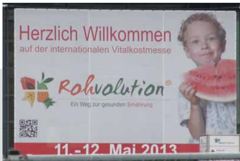
Strotzend vor Gesundheit?: Plakat zur Rohkostmesse 2013 in Freiburg

Krankheiten, Behinderungen und Leiden eines Lebens, im Alter und sogar im Sterben Quellen des Glücks zu finden. Behinderung kann auch eine Fähigkeit sein. Manch geistig Behinderter hat mehr echte menschliche Herzlichkeit als wir „Normopathen“. Krankheit kann der Aufruf sein, ein dahinplätscherndes Leben zum eigentlich Wichtigen zu lenken. Marcel Reich-Ranicki hat einmal gesagt, jede gute Literatur habe mit Leiden zu tun. Und kein Zweifel, eine Gesellschaft die die Jugend und nicht das Alter ehrt, ist immer eine unglückliche Gesellschaft, denn da schaut schon der Sechzehnjährige, wenn er in die Zukunft seines Lebens schaut, ins Dunkel seiner Lebenszukunft. Anti-aging, wenn es trendy und emphatisch angepriesen wird, ist im Grunde lukrative Volksverdummung. Und wie steht es schließlich mit dem Tod, dem Todfeind der Gesundheitsreligion? Freund Hein nannte ihn liebenswürdig eine weisere Zeit. Denn ein unendliches Leben ohne Tod, das wäre die Hölle. Alles wäre korrigierbar, nichts wäre endgültig und damit wäre alles gleichgültig. Ein solches Leben wäre die totale Langeweile, wahrhaftig, es wäre die Hölle. Nur dadurch, dass wir sterben, wird jeder Moment unseres Lebens unwiederholbar wichtig und kostbar. Die unvermeidlichen Grenzsituationen annehmen, das ist wahre Lebenskunst.