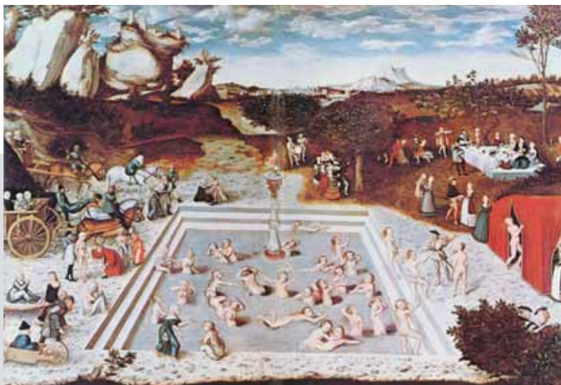
„Forever young“ Anno 1540: Lucas Cranach d. Ä. (1472-1553): Der Jungbrunnen