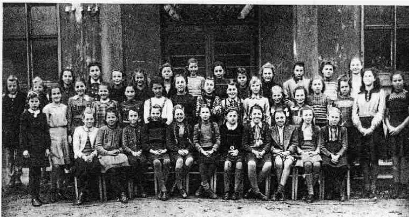
Die erste Sexta des Ursulinen-Gymnasiums, Mannheim