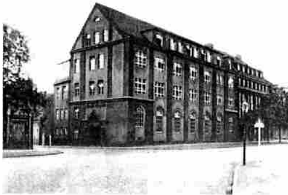
Schweidnitz, Sankt Angela