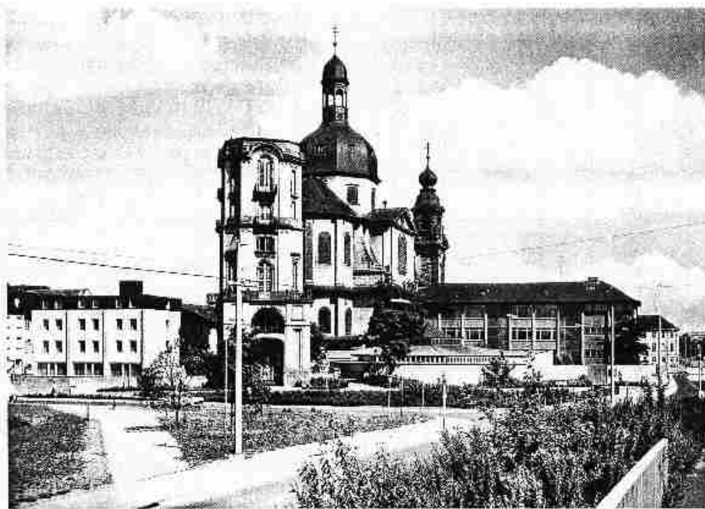
Das Ursulinen-Gymnasium, eingebettet in den Schutz der Jesuitenkirche, bewacht von der alten Sternwarte und umsäumt vom Efeu des Klostersgartens – so bildet es seit fast 50 Jahren eine lebendige Oase inmitten der Großstadt Mannheim